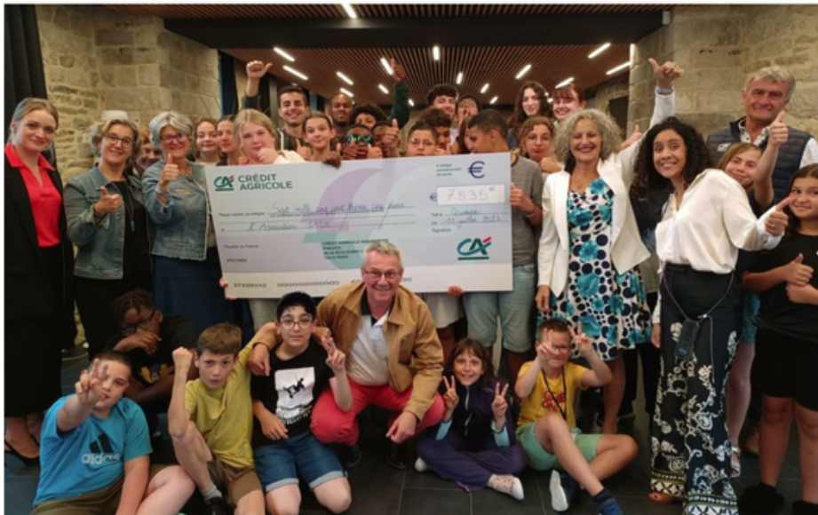
Depuis le 8 juillet, les Jeunes aidants de France séjournent au Domaine de la Porte neuve à Riec-sur-Bélon.

Pour la troisième année consécutive, l'association nationale Jeunes aidants ensemble (Jade) organise un séjour de vacances répit pour 25 jeunes du 8 au 15 juillet au Domaine de la Porte neuve à Riec-sur-Bélon.